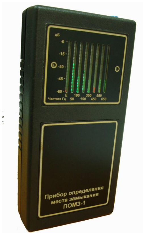
Рис. 1. Внешний вид приемника ПОМЗ-02.